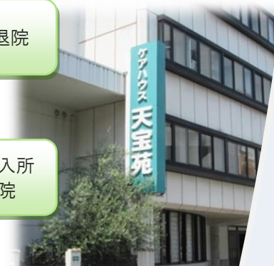
↓ケアハウス天宝苑